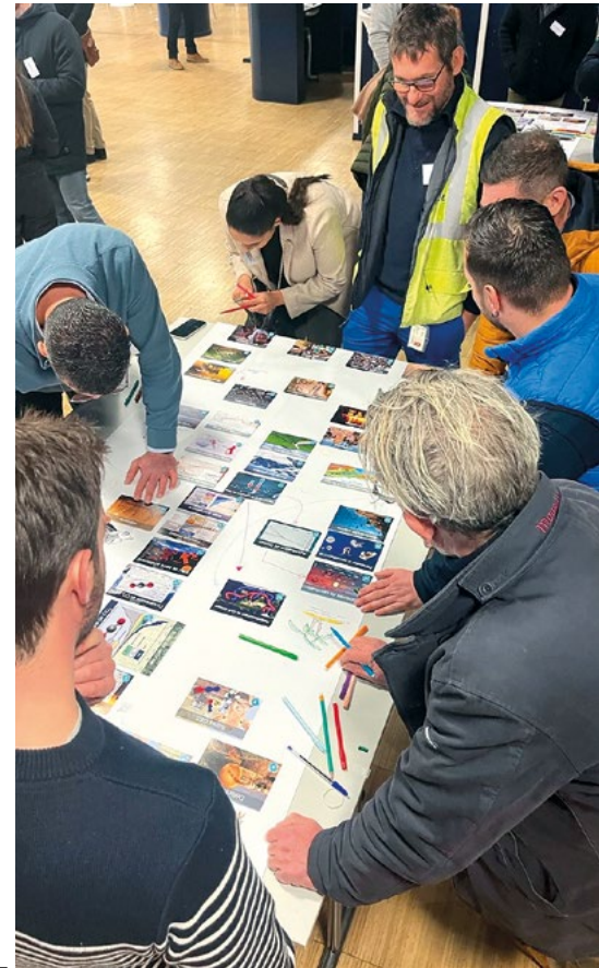
Atelier fresque du climat – Regaz Bordeaux